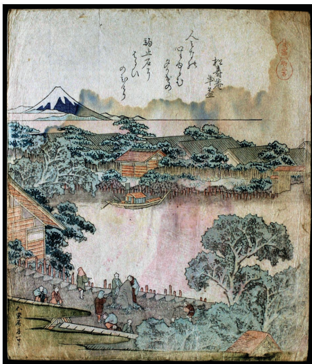
カラー図1の3 版葛飾北斎「馬尽」シリーズ 「駒止石」（1822年）