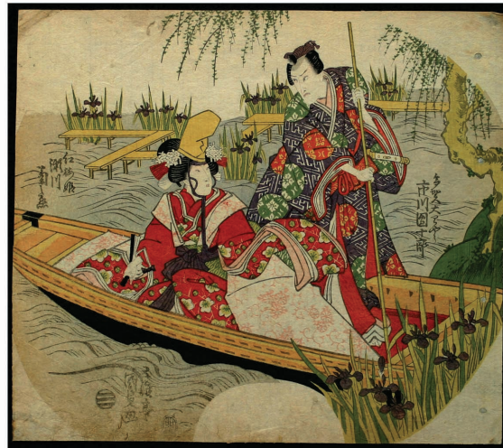
カラー図版1の4 歌川国貞「多賀大領」（1819年）