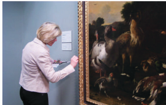
カラー図版3 イキシビジョン・コンサヴァターによる作品管理 「イキシビジョン・コンサヴァターの意義」大原秀之 関連資料