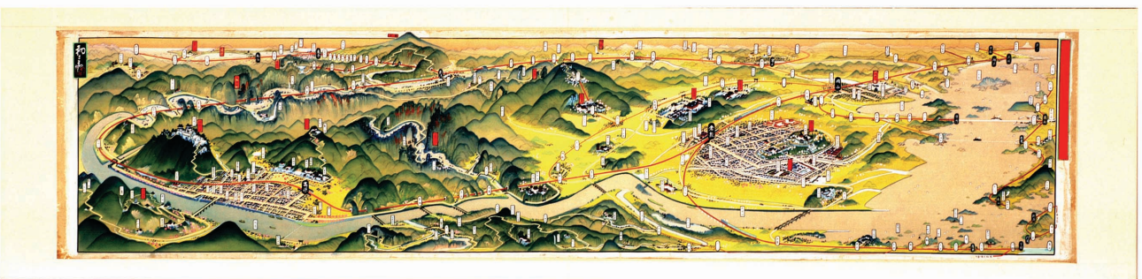
カラー図版2「伯備沿線鳥瞰図」 「吉田初三郎『伯備沿線鳥瞰図』修復についての一考察」関連資料