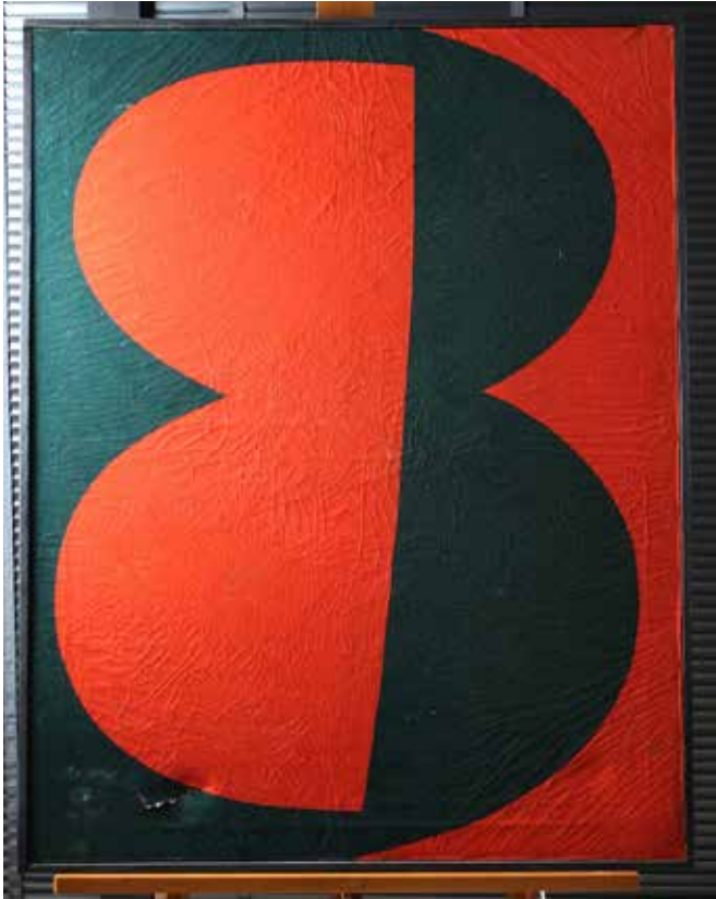
【カラー図版1】 処置前 通常光撮影