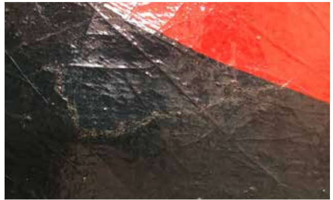
【カラー図版5】 充填および補彩後