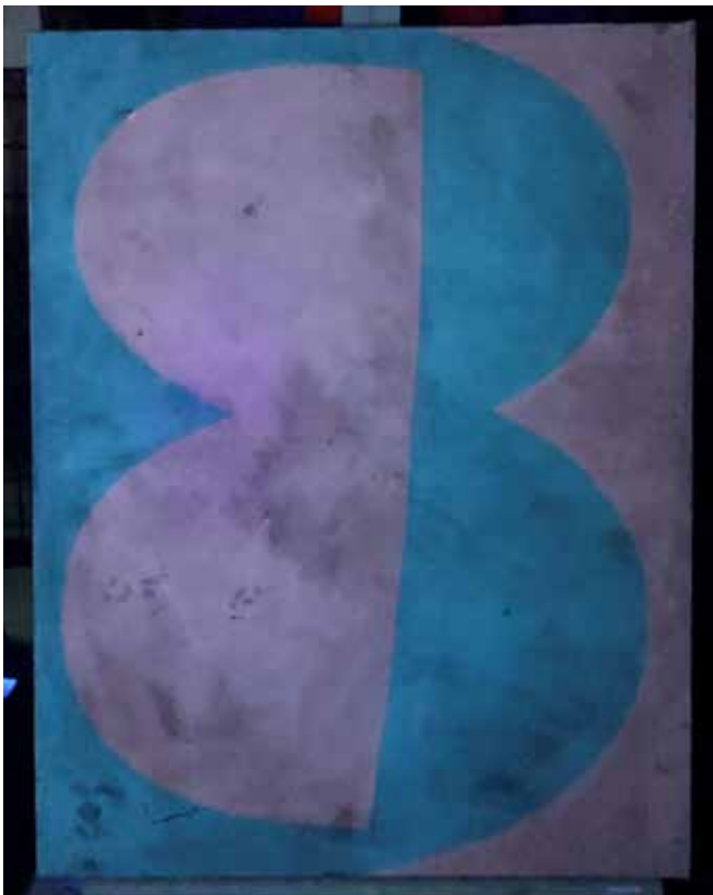
【カラー図版2】 処置前 紫外線写真 旧補彩箇所が蛍光している