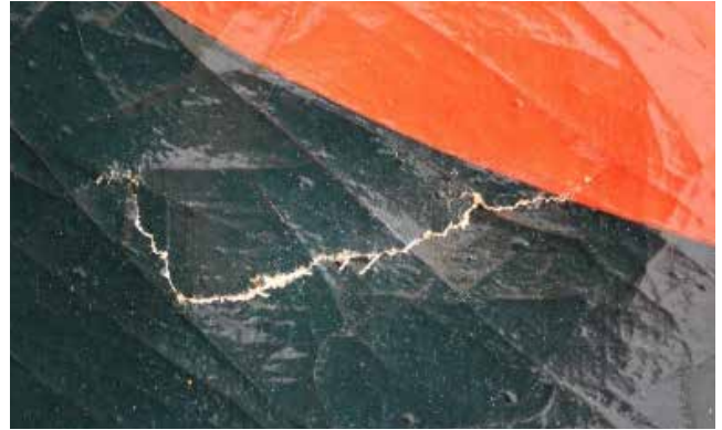
【カラー図版4】 処置前