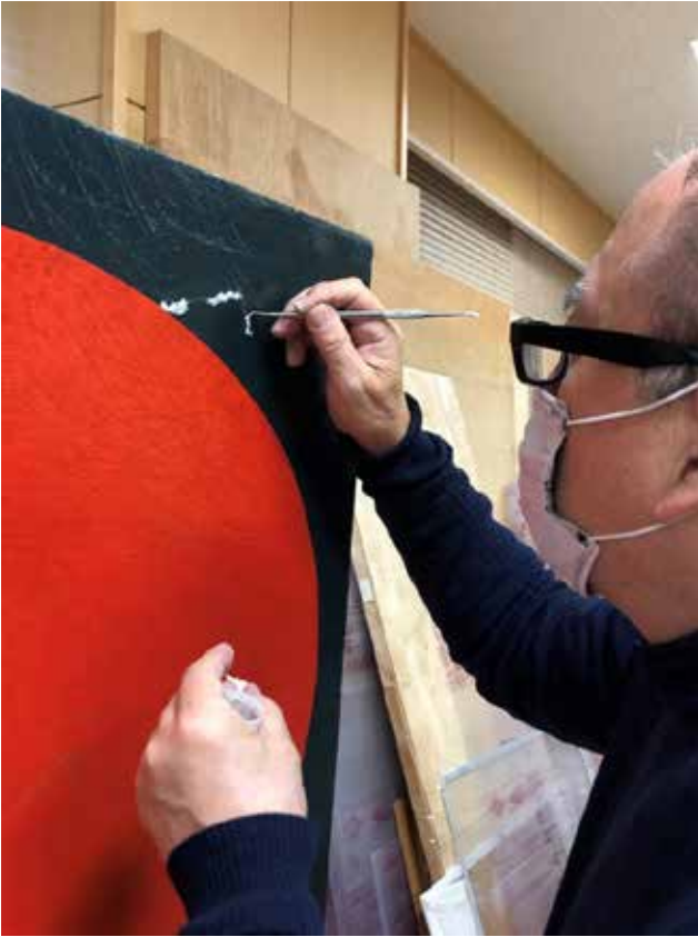
【カラー図版3】 充填作業