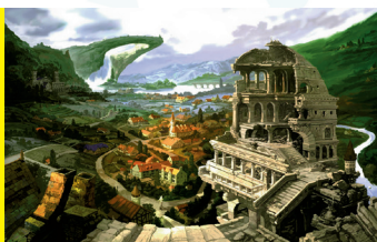
忘却の旋律 イメージボード 村全景