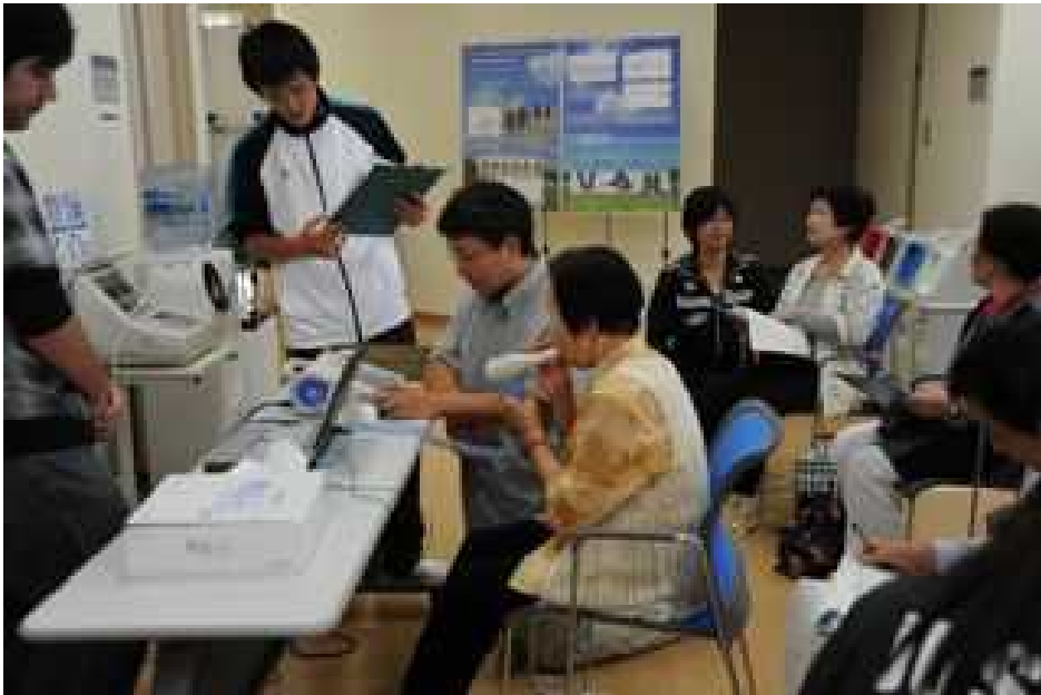
皆さんの肺年齢を測定中です。