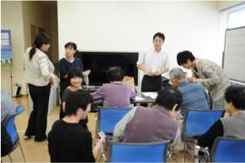
皆さんに万歩計の使い方を説明しています。