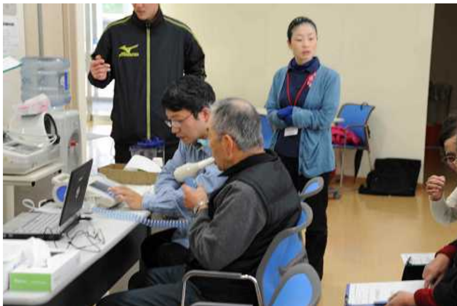
こちらでは肺年齢測定を実施中です。