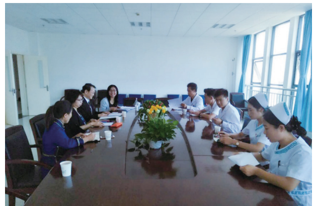
写真7. 院長・看護部長・看護師への面接調査

院長によれば大学生以外の外来患者も受け入れているが、保険制度が違うので数は少ない。看護師の初任給は4,000元だと看護部長が断言したが、他の病院よりかなり高額で、しかも看護師から回収したアンケート調査では5名中2名（20代後半・大学本科卒業）が月収3,500～3,999元だと答えている。真偽は不明である。