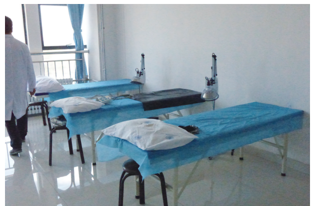
写真8. 診察・施療用ベッド

院長によれば大学生以外の外来患者も受け入れているが、保険制度が違うので数は少ない。看護師の初任給は4,000元だと看護部長が断言したが、他の病院よりかなり高額で、しかも看護師から回収したアンケート調査では5名中2名（20代後半・大学本科卒業）が月収3,500～3,999元だと答えている。真偽は不明である。