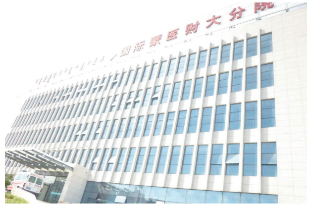
写真6. 国際蒙古医医院内蒙古財經大学分室

蒙医（モンゴル医療）の専門病院であることもあり、モンゴル族の看護師が多い。三交代制で看護配置は20：1。当病院は医師16人に対し看護師12人で医師のほうが多い。週休は1日。訪問時は大学生の身体検査の日で外来患者はほとんどいなかったが、普段はきわめて多忙で、週休0のこともあるという。