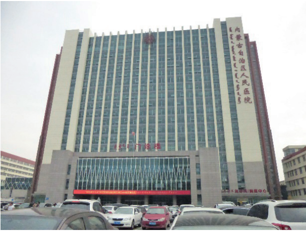
写真1. 内蒙古自治区人民医院