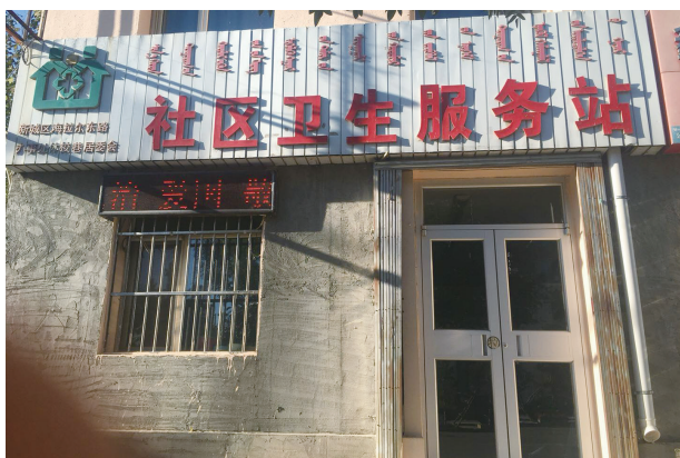
写真9. 新城区社区服務衛生ステーション

看護師は3人。週休は1日。給料は2,300元である。看護師はやや不足気味。看護師の募集はインターネット広告に応募してくる場合もあるが知り合いからの紹介が多い。当服務ステーションの看護師によれば「看護師が辞める理由はただひとつ。あまりにも給料が安い」からだ。研修といったものは特にない。