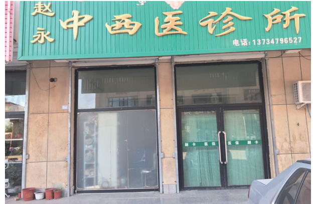
写真13. 趙永中西医診療所