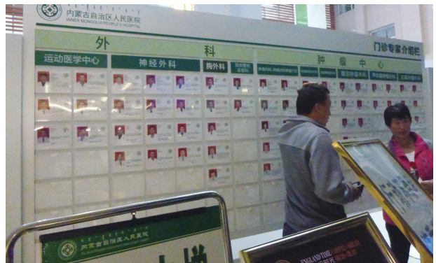
写真3. 各科医師一覧

休日は週休2日、約半年の産休が保障されている。給与は初任給1,856元。これに各種手当が加算されても、20代前半の若い看護師の給与は3,000～3,500元（日本円で5～6万円）程度であろう。2016年12月に行われた看護師に関する全国調査（中国护士群体发展现状调查报告）によれば北京・上海のような一級都市（一线城市：19都市）の看護師平均月額給与は6,700元（11万4,570円）、無錫・長春と