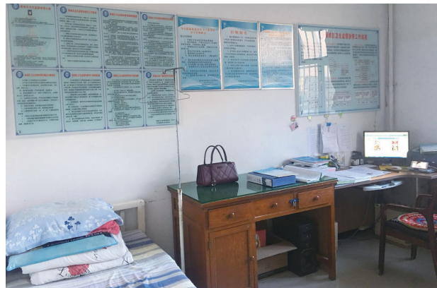
写真10. 新城区社区服務衛生ステーション 診察室