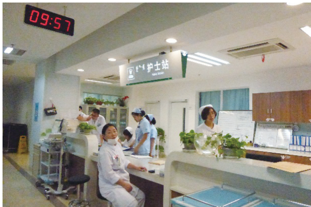
写真4. 内蒙古自治区人民医院 ナース・ステーション

いった二級都市（二线城市：30都市）は5,600元（9万5,760円）で、都市部労働者の平均月収よりやや低いらしい。 13) ちなみに呼和浩特は三級都市（三线城市：70都市）である。 14)