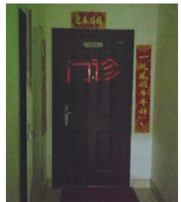
写真17. 后巧報鎮武達珍診療所 入り口

看護師は息子の嫁(45歳)で、生活費として月2,000元を渡している。診療所の棚に大量の医薬品が並べられていた。「薬を売っている」という本人の話から推測すれば、薬局のようなこともして利益を出しているのかも知れない。W医師によれば「マンション住民の人達に大いに喜ばれている」らしい。しかしながら中国の医療および医療制度は急速に改善されつつあり、このような文化大革命時代に育成された医師や彼らの診療所は近い将来消えてゆくだろう。