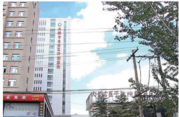
写真5. 内蒙古自治区腫瘍病院

1921年、帰綏鉄道病院として設立される。2004年内蒙古医科大学の管轄となり、2012年に内蒙古自治区腫瘍病院に改称した。総合病院ではあるが病院名から分かるように癌専門病院といってよい。インタビューに答えてくれたのは同病院の看護師。残念ながら病院内部の撮影は許可されなかった。