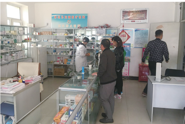
写真12. 新城区社区服務衛生ステーション 薬局