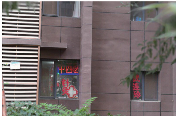
写真16. 后巧報鎮武達珍診療所

W医師の知り合いに頼んで入り口周辺の写真を撮ってもらった。診療所は居住用マンション1階にある。大学院留学生（江蘇省鎮江市出身）によれば「マンションの一室で医院を開業するのは違法」であるとのことだが、呼和浩特市の状況は不明である。