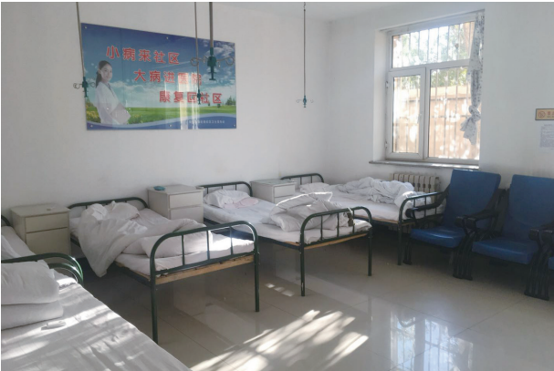
写真11. 新城区社区服務衛生ステーション 処置室