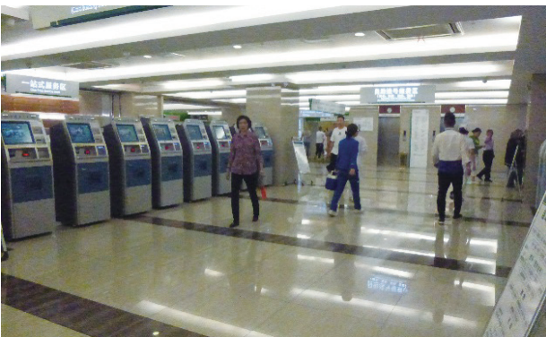
写真2. 自動化された受付

内蒙古自治区人民医院は1974年に設立された内蒙古自治区でも最高レベルの国立病院である。病院内を案内し、インタビューに答えてくれたのは事務部長のW.L氏である。当病院は内蒙古自治区の最高レベルの病院で、共産党幹部専用の病棟も設置されている。受付やカルテなどはすべて情報化、自動化されており、設備、医療技術、診療システムなど日本の大病院と比較しても遜色はない。