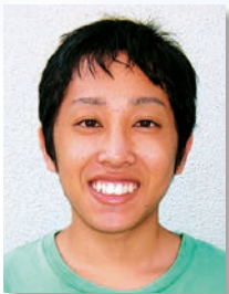
プロコンサート代表

今年から伊賀祭は2日間になったので、昨年までの3日分の楽しさを2日間で表現出来る様、皆で協力しながら一生懸命頑張りたいと思いますので、是非遊びに来て下さい。お待ちしております。