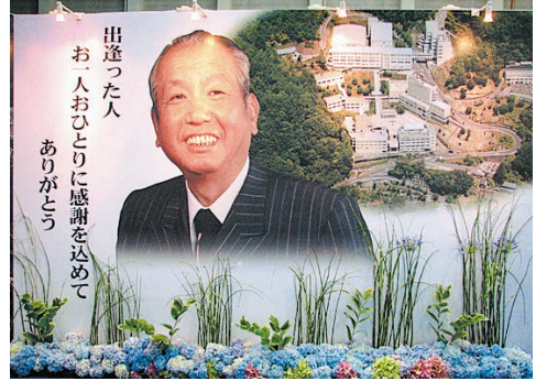
出逢った人 お一人おひとりに感謝を込めて ありがとうございます