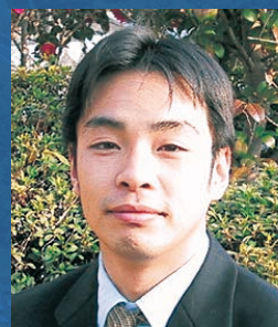
同窓会会長 吉備国際大学社会学子部