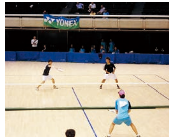
写真奥側が吉備国際大学

男子ソフトテニス部が中国学生ソフトテニスリーグ戦大会(平成26年4月30日)・平成26年5月3日於山口県周南市)で全勝優勝(一部リーグ5勝0敗)を果たし、第34回全日本大学ソフトテニス王座決定戦(平成26年6月24日)・平成26年6月26日於東京体育館)への出場を果たしました。 6年ぶり9回目の出場となった本大会にチーム一丸となって臨みましたが、結果的には予選リーグにて韓国代表の忠北大学(1勝4敗で敗退)、九州地区代表の福岡大学(2勝3敗で敗退)と惜敗し予選リーグ敗退となりました。 同大会過去最高実績の3位入賞には手が届きませんでした。今後とも学生らしくひたむきに精進し、さらに上位の結果を目指し続けたいと思います。応援よろしくお願ひします。