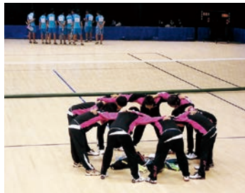
写真手前が吉備国際大学