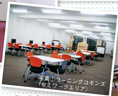
写真②ラーニングcommons (ゼミワークエリア)