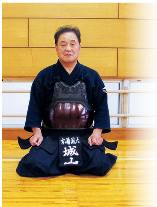
社会科学部 スポーツ社会学科