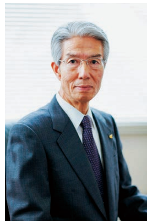
吉備国際大学 第7代学長